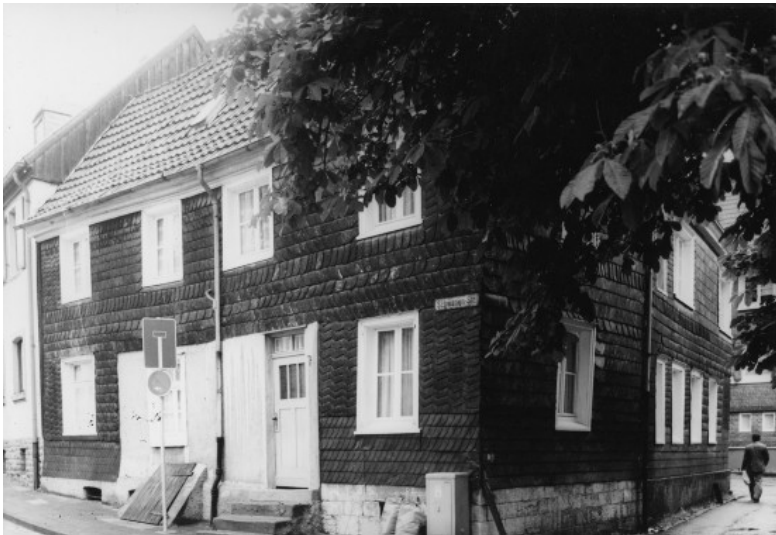
Wohnhaus Linde, Schwanenstraße 7 in Wülfrath (1978)