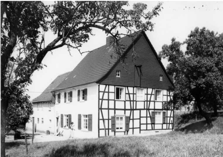
Gut Beek, Nord-Erbach 48 in Wülfrath (1978)