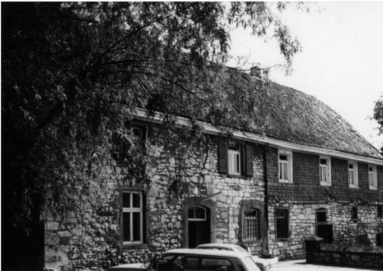
Gut Hugenhaus, Nord-Erbach 18 in Wülfrath (1978)