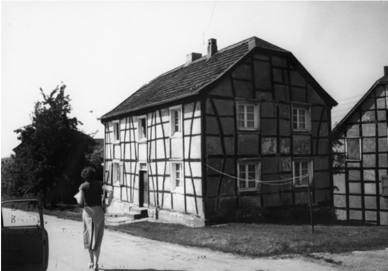
Hof Kocherscheidt in Wülfrath (1978)