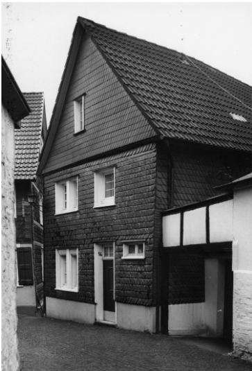
Fachwerkwohnhaus Hechtshaus, Kirchplatz 16 in Wülfrath (1978)