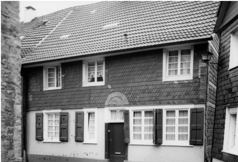
Fachwerkwohnhaus Jostenhaus, Kirchplatz 15 in Wülfrath (1978)