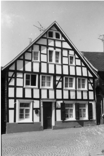
Fachwerkwohnhaus Frythof, Kirchplatz 13 in Wülfrath (1978)