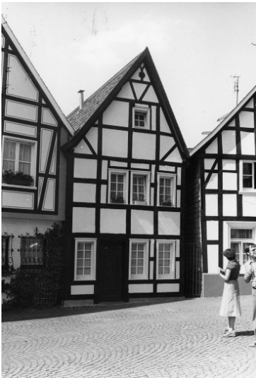
Fachwerkwohnhaus Kleine Klaus, Kirchplatz 12 in Wülfrath (1978)