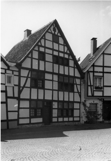
Fachwerkwohnhaus Scholle, Kirchplatz 10 in Wülfrath (1978).