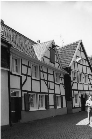
Fachwerkwohnhaus Aufm Keller, Kirchplatz 8 in Wülfrath (1978)