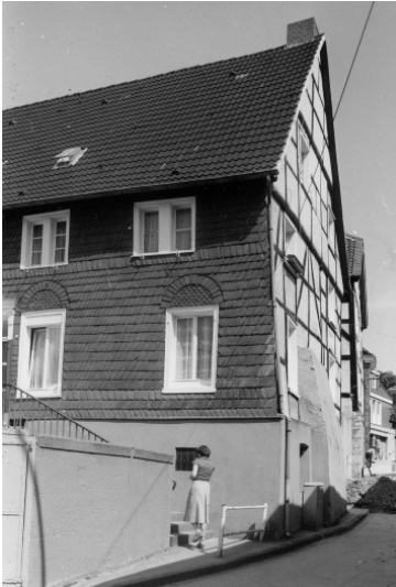
Fachwerkwohnhaus Hamels, Kirchplatz 6 in Wülfrath (1978)