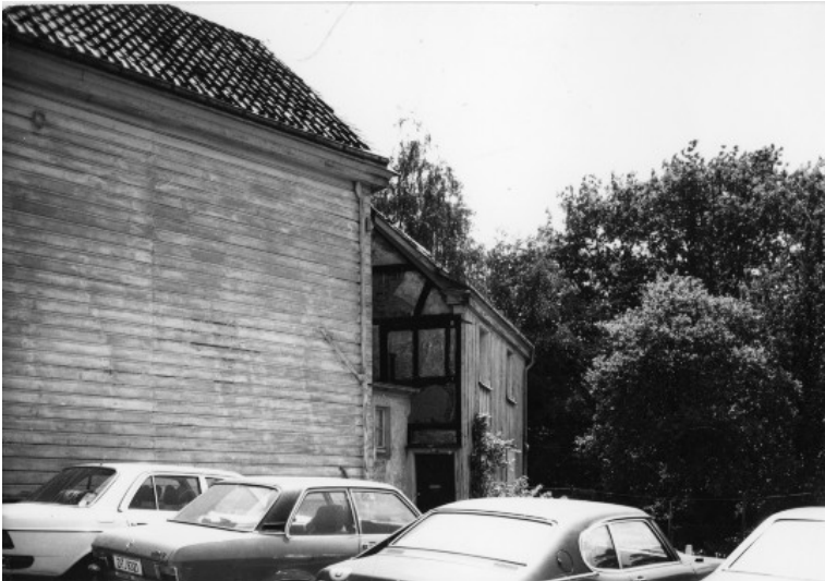
Wohnhaus Hinterhaus zu Haus Bleek, Heumarktstraße 11 in Wülfrath (1978)