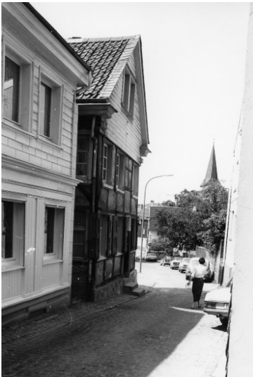
Wohnhaus Bleek, Heumarktstraße 9 in Wülfrath (1978)