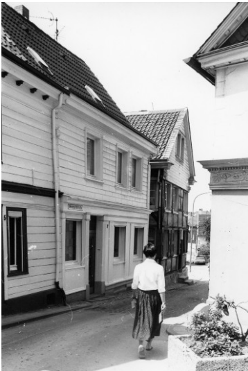
Wohnhaus Scheune, Heumarktstraße 7 in Wülfrath (1978).