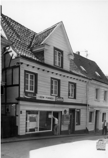
Wohn- und Geschäftshaus Roßkamp, Heumarktstraße 5 in Wülfrath (1978)