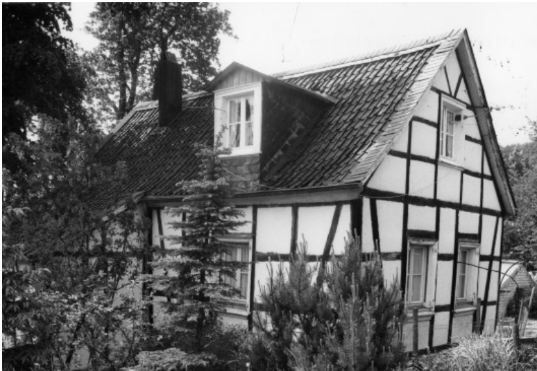
Fachwerkwohnhaus Gut Langensiepen, Diakonissenweg 13 in Wülfrath-Schlupkothen (1978)