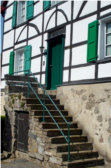
Haan-Gruiten, Doktorhaus (2024)