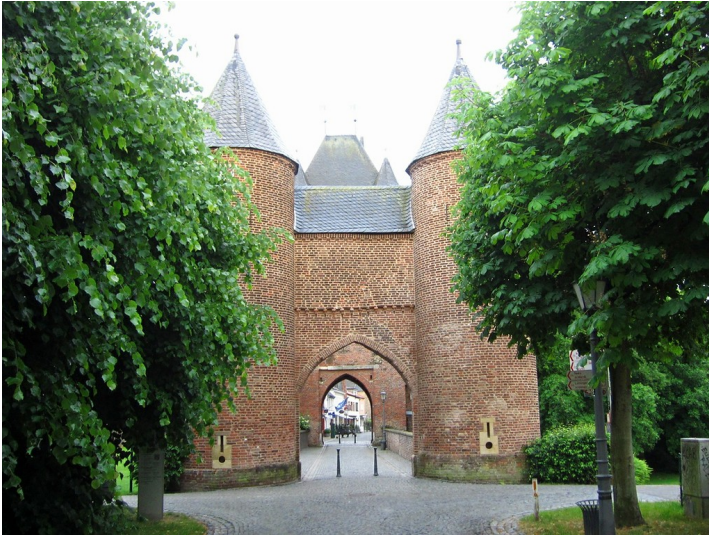
Äußerer Torbau des 1393 erbauten Doppeltors "Klever Tor" in Xanten von der stadtauseren Seite aus (2013)