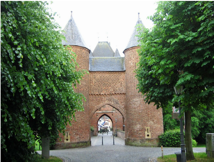
Äußerer Torbau des 1393 erbauten Doppeltors "Klever Tor" in Xanten von der stadtausseren Seite aus (2013)