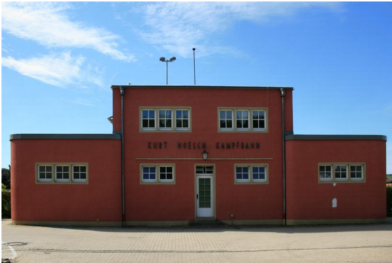
Das Clubhaus der Kurt-Hoesch-Kampfbahn in Kreuzau (2010).