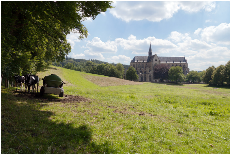
Odenthal-Altenberg, Altenberger Dom, ehem. Zisterzienser-Abteikirche St. Maria Himmelfahrt