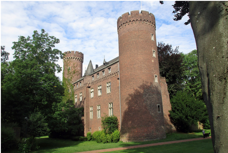
Blick nach Nordwesten auf die zweiflügelige Wasserbürgeranlage im Kempener Ortskern (2017).