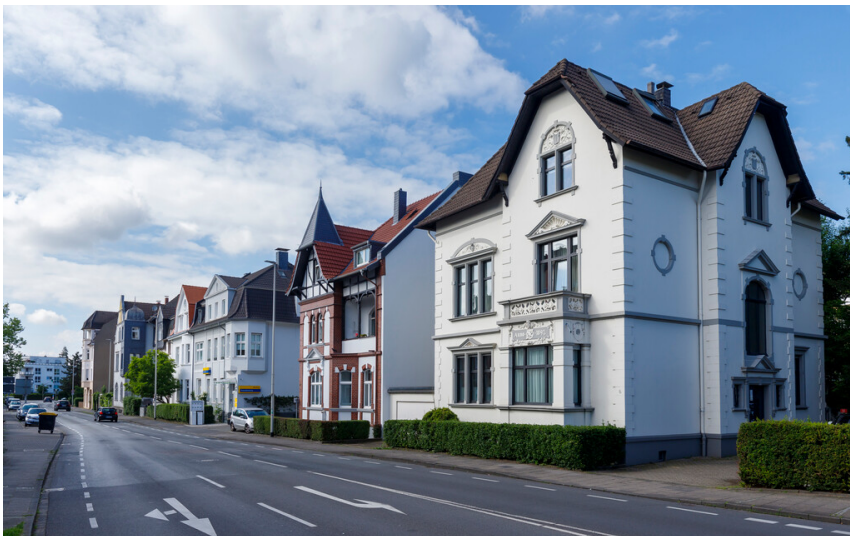
Ansicht des Denkmalbereichs Hilden - Ellerstraße in Richtung Norden (2024).