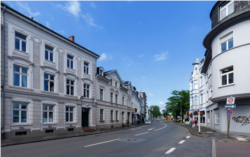
Ansicht des Denkmalbereichs Hilden - Benrather Straße in Richtung Osten (2024).