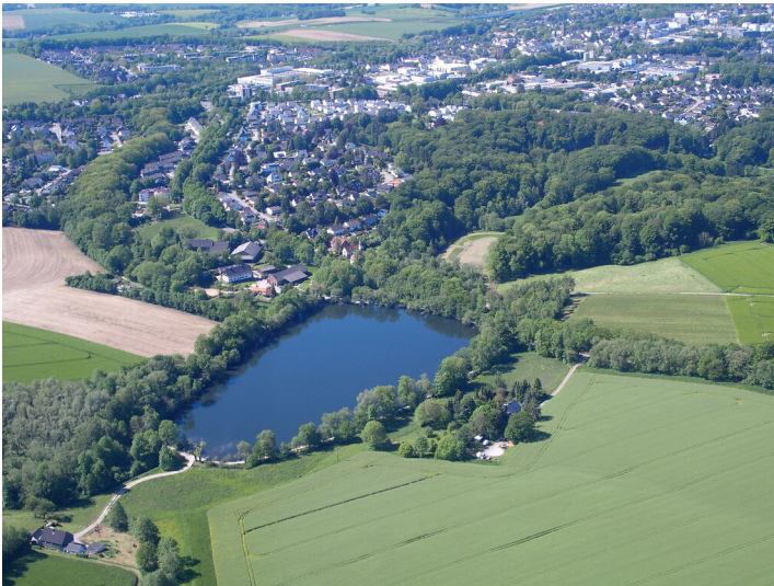
Abtskücher Teich (2021)