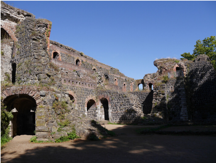
Kaiserpfalz in Kaiserswerth (2019)