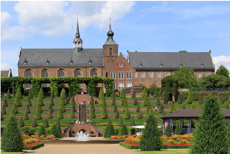
Kloster Kamp bei Kamp-Lintfort, Ansicht über die Terrassengärten (2015).