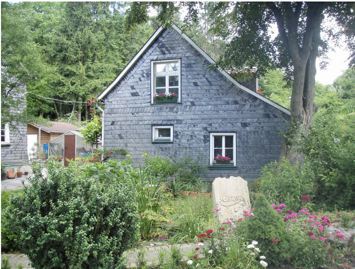
Wülfrath-Schlupkoth, Diakonissenweg 15, Gut Langensiepen (2009)