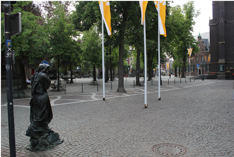
Kapellenplatz in Kevelaer (2012)