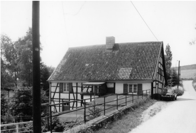
Mühlengebäude der Stippelsmühle in Wülfrath (1978)