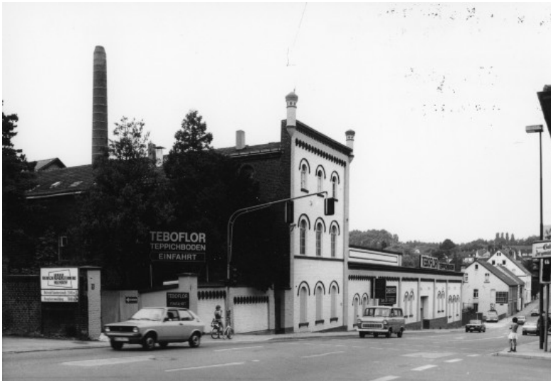
Fabrikgebäude Herminghaus in Wülfrath (1978)