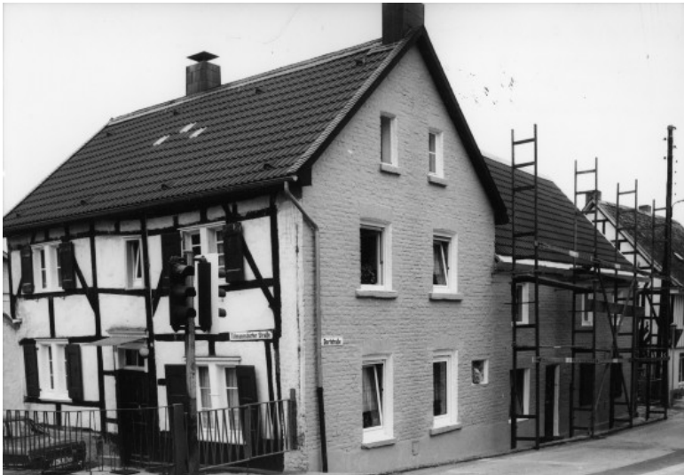
Fachwerkwohnhaus, Tillmannsdorfer Straße 27 in Wülfrath-Düsseldorf (1978)