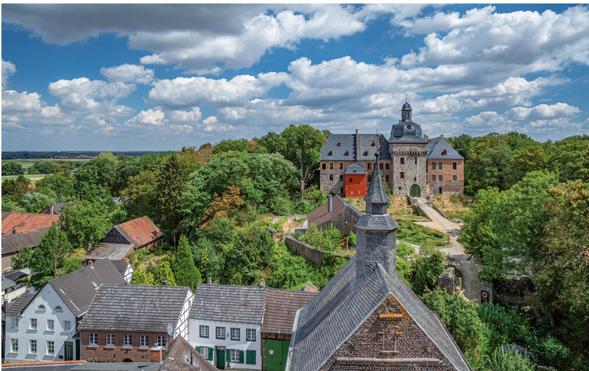
Liedberg mit Schloss (2020)