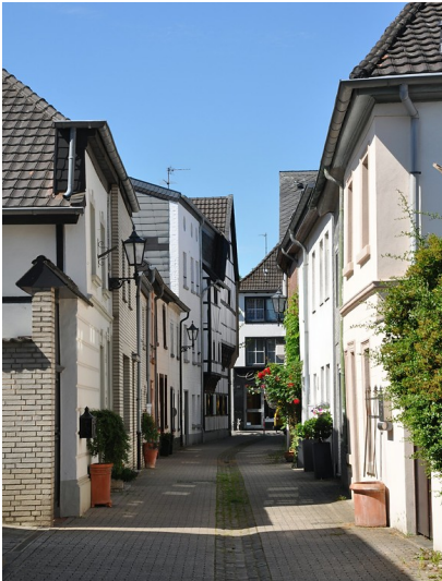
Ältere, zum Teil in Fachwerk ausgeführte Wohnbebauung im Denkmalbereich "Viersen - Süchteln" (2017).