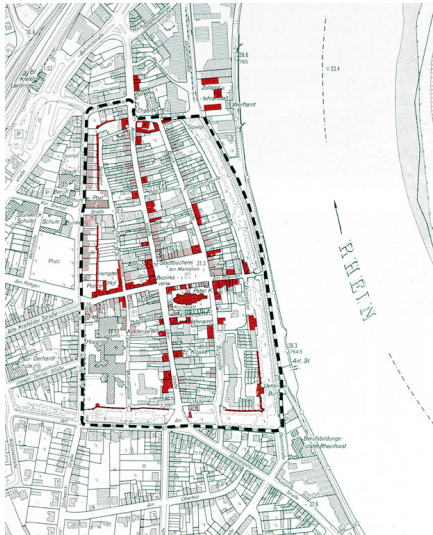
Der Denkmalbereich Krefeld-Uerdingen im Kartenbild (DGK 5, 1996)