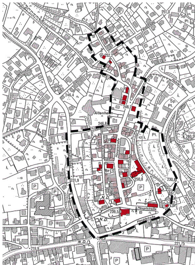
Karte des Denkmalbereichs Bergneustadt-Altstadt (1996) Fotograf/Urheber: Irmela Lieven