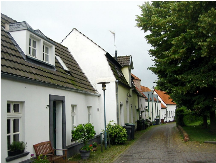
Gebäude am Stadtwall in Kranenburg (2009).