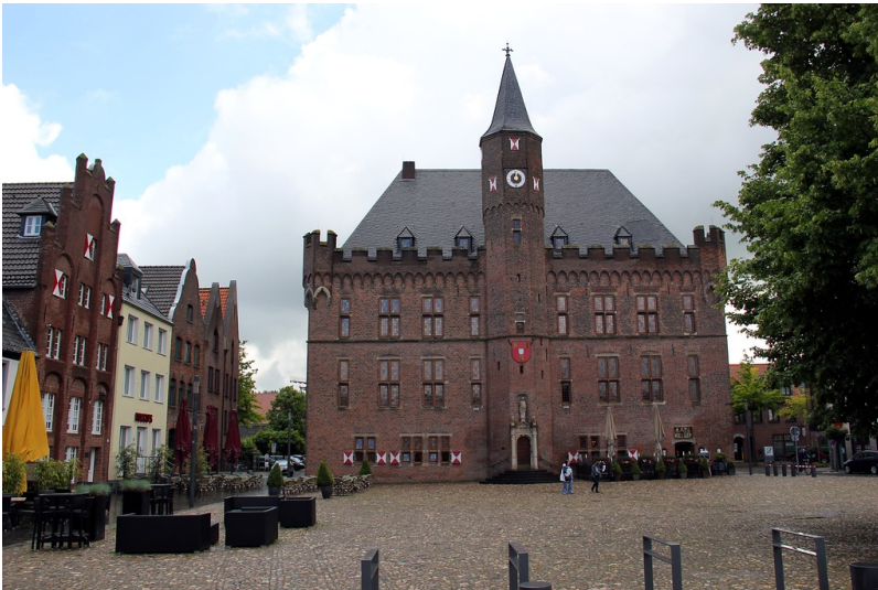
Rathaus von Kalkar (2014)