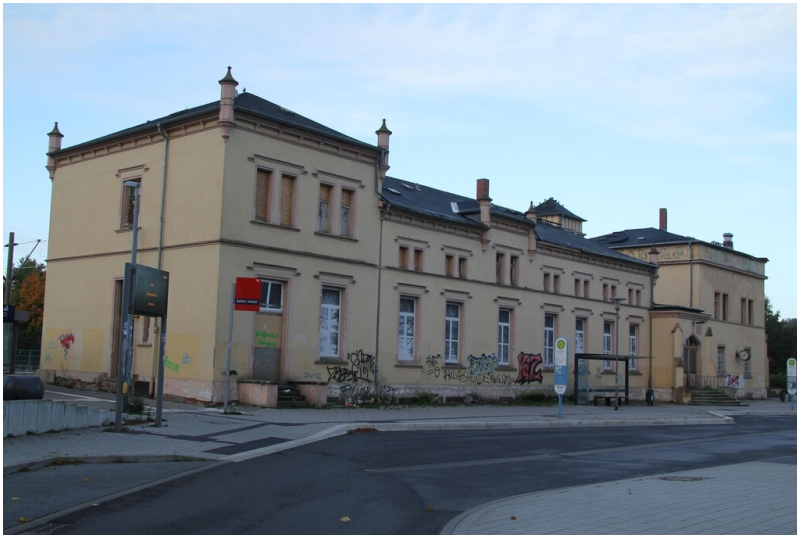
Bahnhof Zerbst