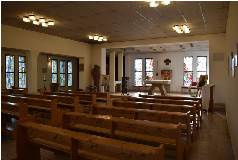
Katholische Kirche St. Anna