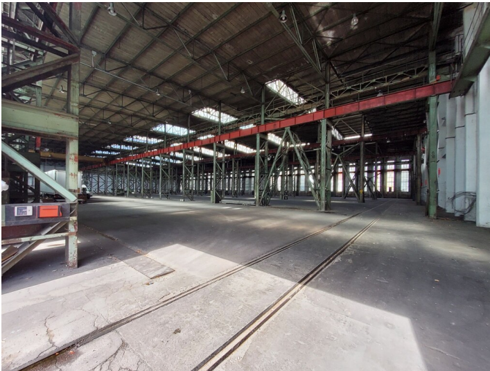
Werksgelände VEB Förderanlagen- und Kranbau Koethen