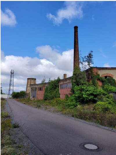
Bahnbetriebswerk Köthen