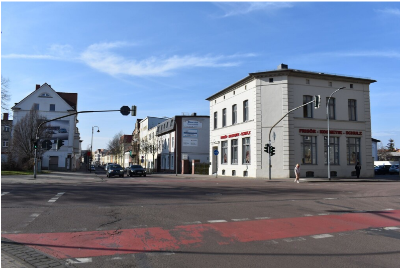
Bahnpostamt Köthen