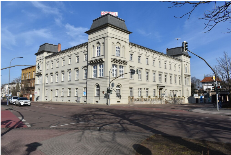
Herzogliche Restauration