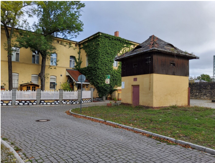
erstes Empfangsgebäude der Magdeburg-Leipziger-Eisenbahn