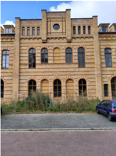
Berlin-Halberstädter Bahnhof - Fassadendetail in der Georgstrasse