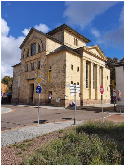
Katholische Kirche St. Maria Köthen