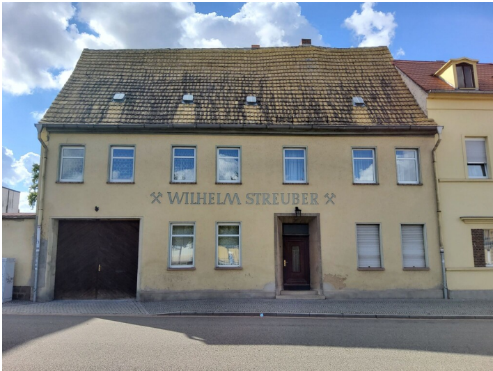
Kohlenhandlung Wilhelm Streuber