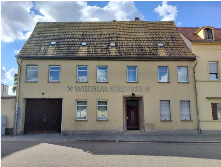
Kohlenhandlung Wilhelm Streuber