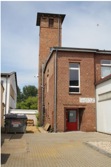
Werksfeuerwehr ehemalige Schwelerei Gölzau