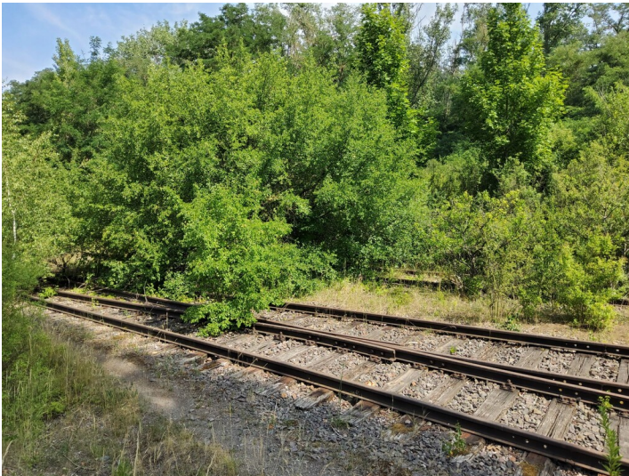
Edderitzer Industriebahn der Grube Leopold - Im Waldstück hinter dem Kulturhaus sind die Schienen auf langer Strecke erhalten